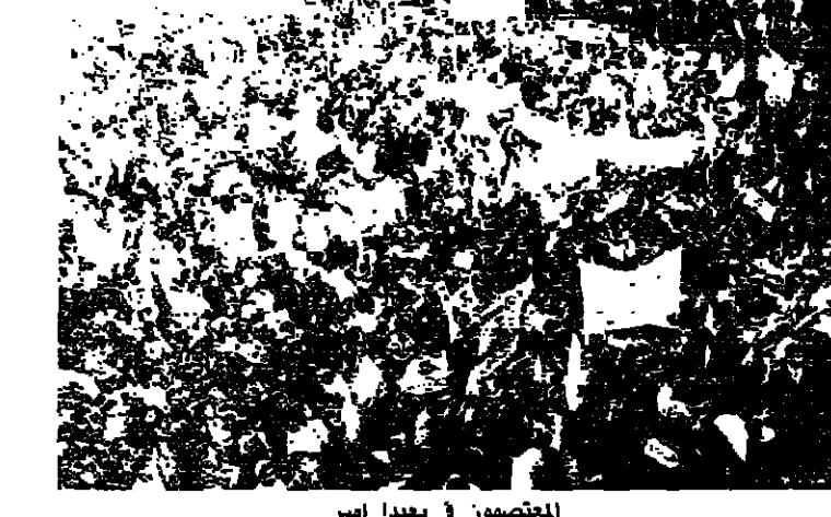
المعتصون في بعثها امس

هو الاساس لاعادة بناء المجتمع الصالح. يوم السبت هو موعد الرهائن الموجودين في سجون سوريا مع الرهائن اللبنانيين المخطوفين من طرابلس وبعبك وصور وصيدا وبيروت ومن كل لبنان. اريد ان اذكر بان اهدافنا الوطنية هي الاساس وعدم الانسياق وراء المشاكل الداخلية التي يخلقها العملاء